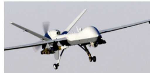
Ramstein ist übrigens keine Band.

durchaus anderes als Frieden ausgehen könnte oder längst ausgeht. Söder, Kretschmann, Bouffier und Dreyer sind vielmehr beunruhigt, dass sich am bestehenden