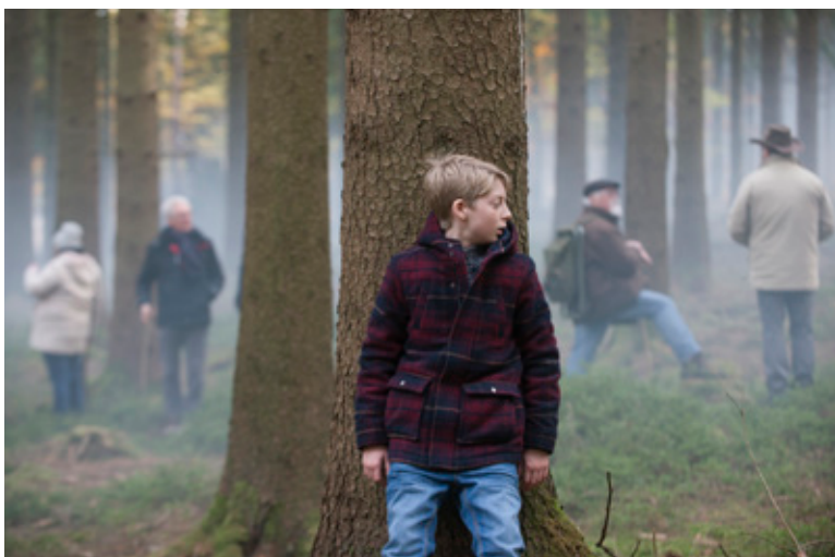
Einer sucht nicht mit im Wald.