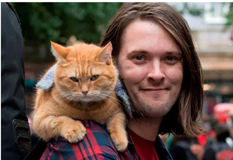
Das Erfolgsduo: Bob und sein Herrchen.

Bis 20. 9. im Lehbruck Museum, Friedrich-Wilhelm-Str. 20, 47051 Duisburg