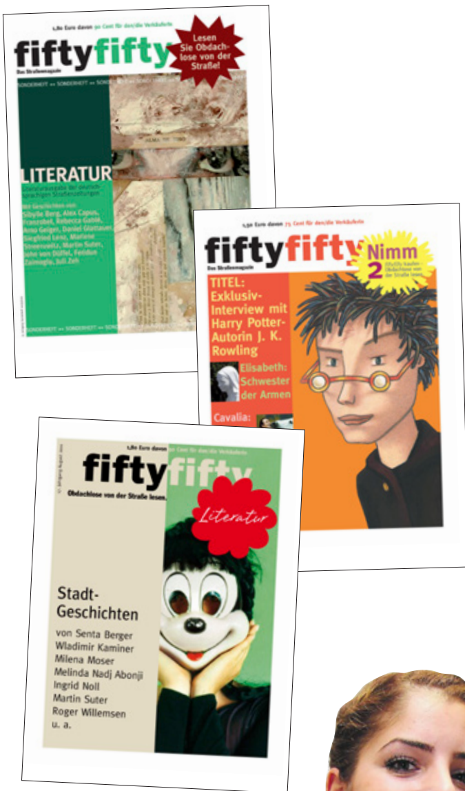
ff-Titelausgaben aus den Jahren 2007, 2010 und 2011 und fiftyfifty -Mitarbeiterin Gül Seven mit Obdachlosen-Hörbuch im Jahr 2010.