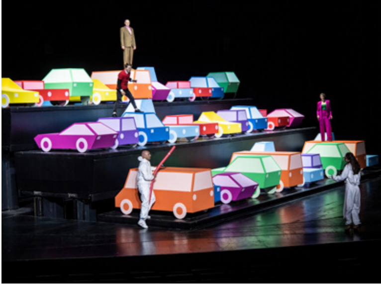
Knallbunte Zukunftsversprechungen.