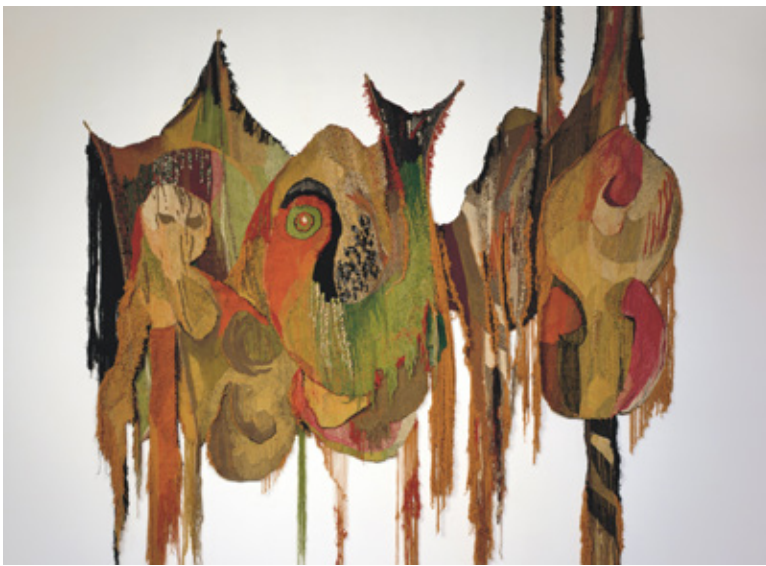
Jirí Tichý, Hommage an Apollinaire , 1979/71, Anatolisch gewebte Tapisserie, Lehbruck Museum © Marie Kosmatová, Foto Jürgen Diemer

11. 9. (Uraufführung), Schauspielhaus/Großes Haus, weitere Aufführungen 13., 20. 9., 1. 10.